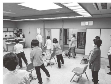
自主的運動教室(サークル)