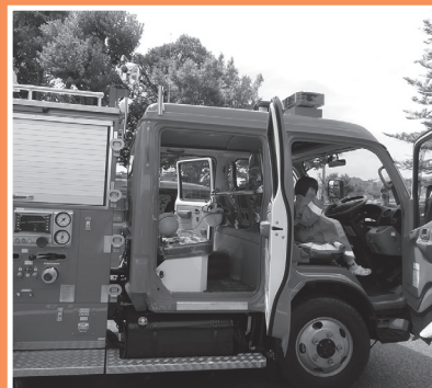
消防車展示・乗車・撮影会