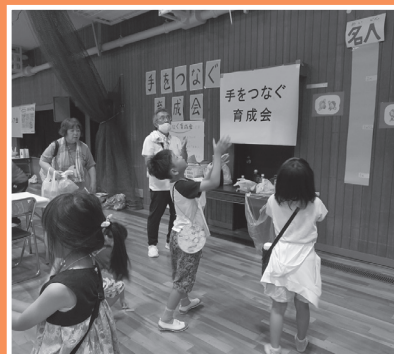
紙トンボで遊ぼう