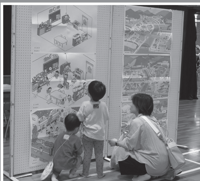
防災まちがいさがし