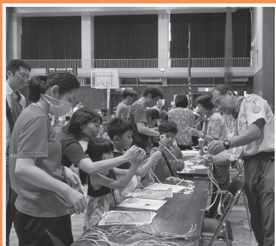
やってみようトンぼむすび