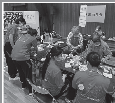
かわいいポンポン作成