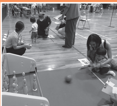
遊び(輪投げ・ボウリング)