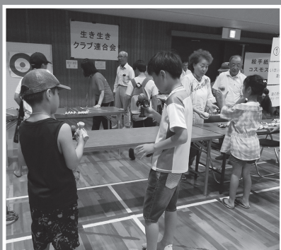
昔の遊び(お手玉・弓矢・剣玉)